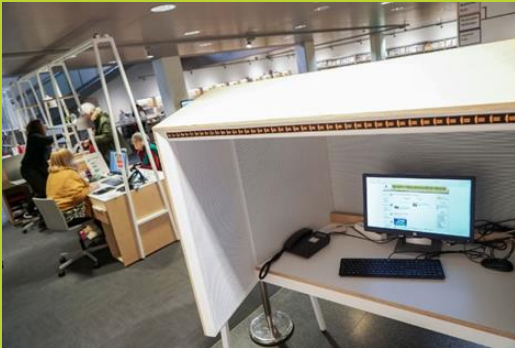
Les Champs libres (Rennes)